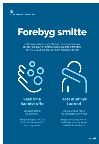
Plakat fra sundhedsstyrelsen