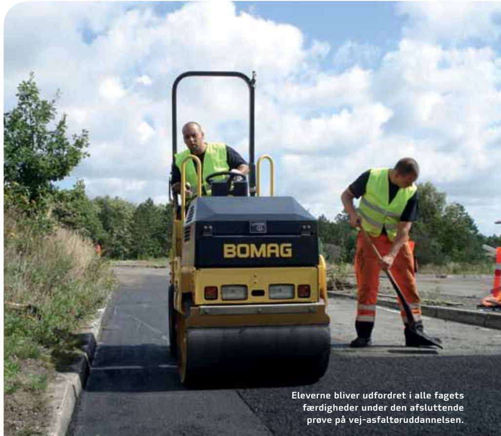
Eleverne bliver udfordret i alle fagets færdigheder under den afsluttende prøve på vej-asfaltøruddannelsen.

Vej-asfaltøruddannelsen blev etableret i 1993 som et samarbejde mellem arbejdsgivere og arbejdstagere i asfaltbranchen. Initiativet blev taget for at opkvalificere branchen i takt med stigende krav til vejentreprenører.