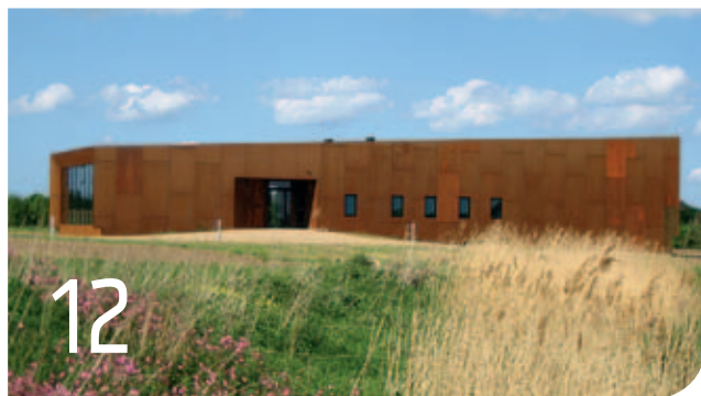
Det nye Vej- og Bromuseum er åbnet