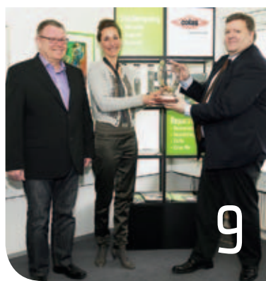
Colas vinder pokal i arbejdsmiljø