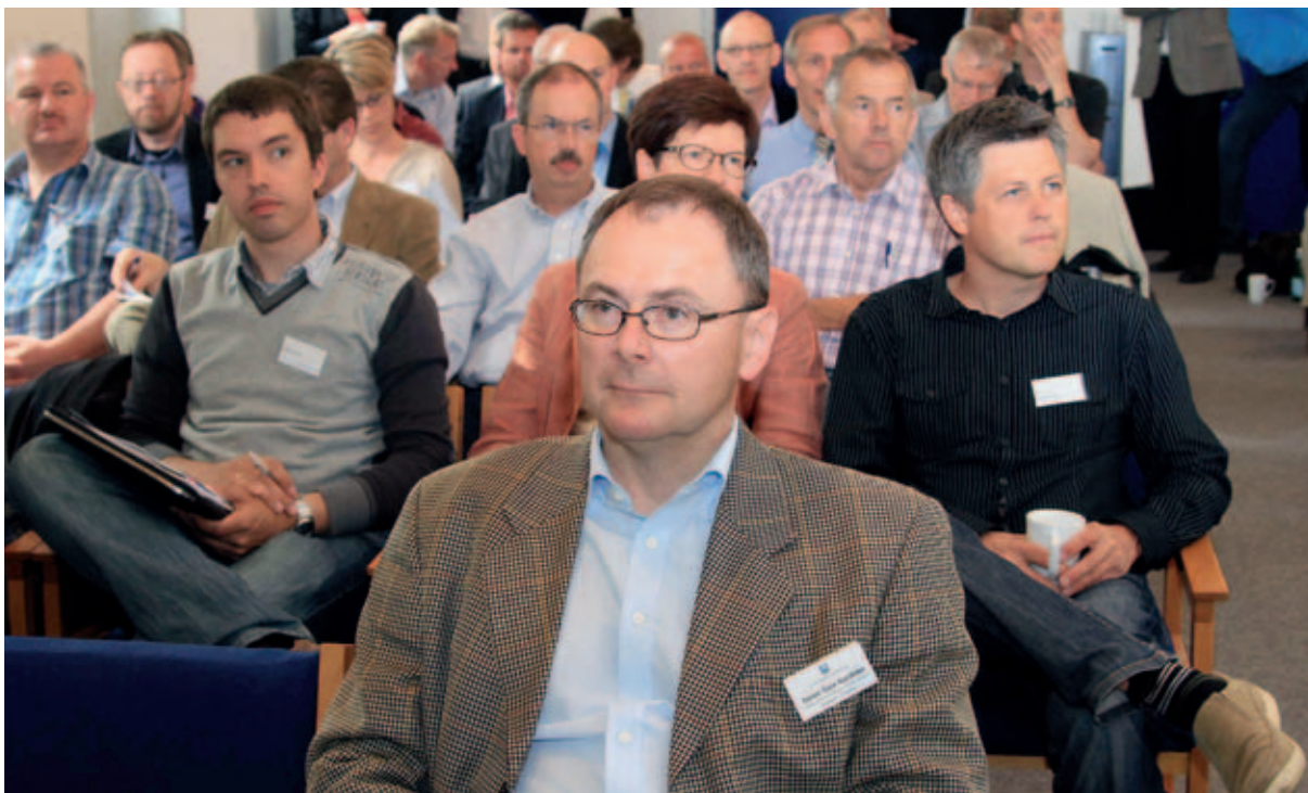
Tilhørerne lyttede til en lang række oplægsholdere, hvoraf flere anbefalede teknikere og embedsmænd at tale i et sprog, som alle forstår.