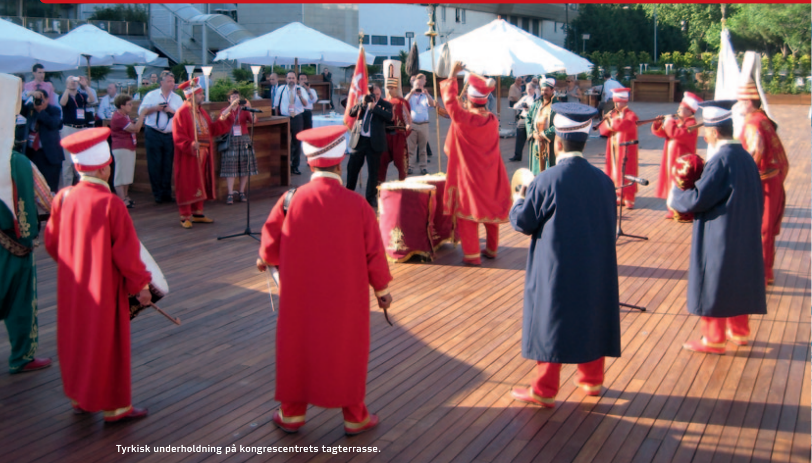
Tyrkisk underholdning på kongrescentrets tagterrasse.

deratoren på grund af tidspresset ofte måtte jappe hurtigt igennem stoffet.