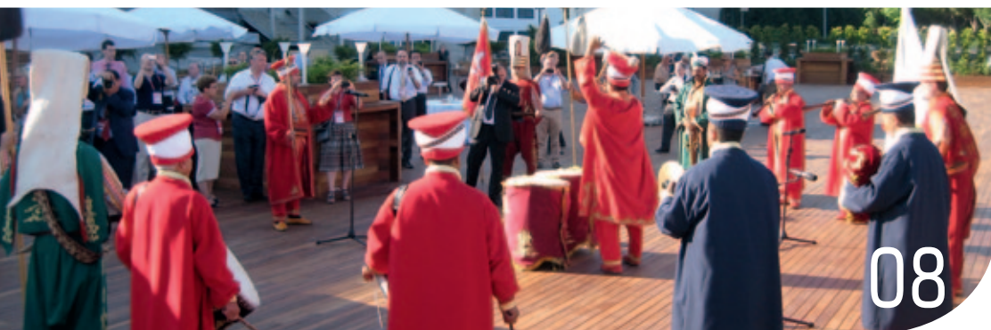
Alverdens asfaltfolk forsamlet i Tyrkiet 13.-15. juni.