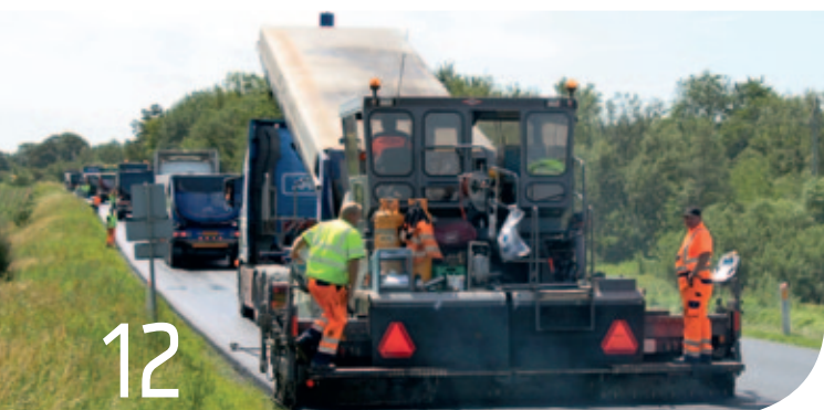
Asfaltbranchen har fået nye overenskomster.