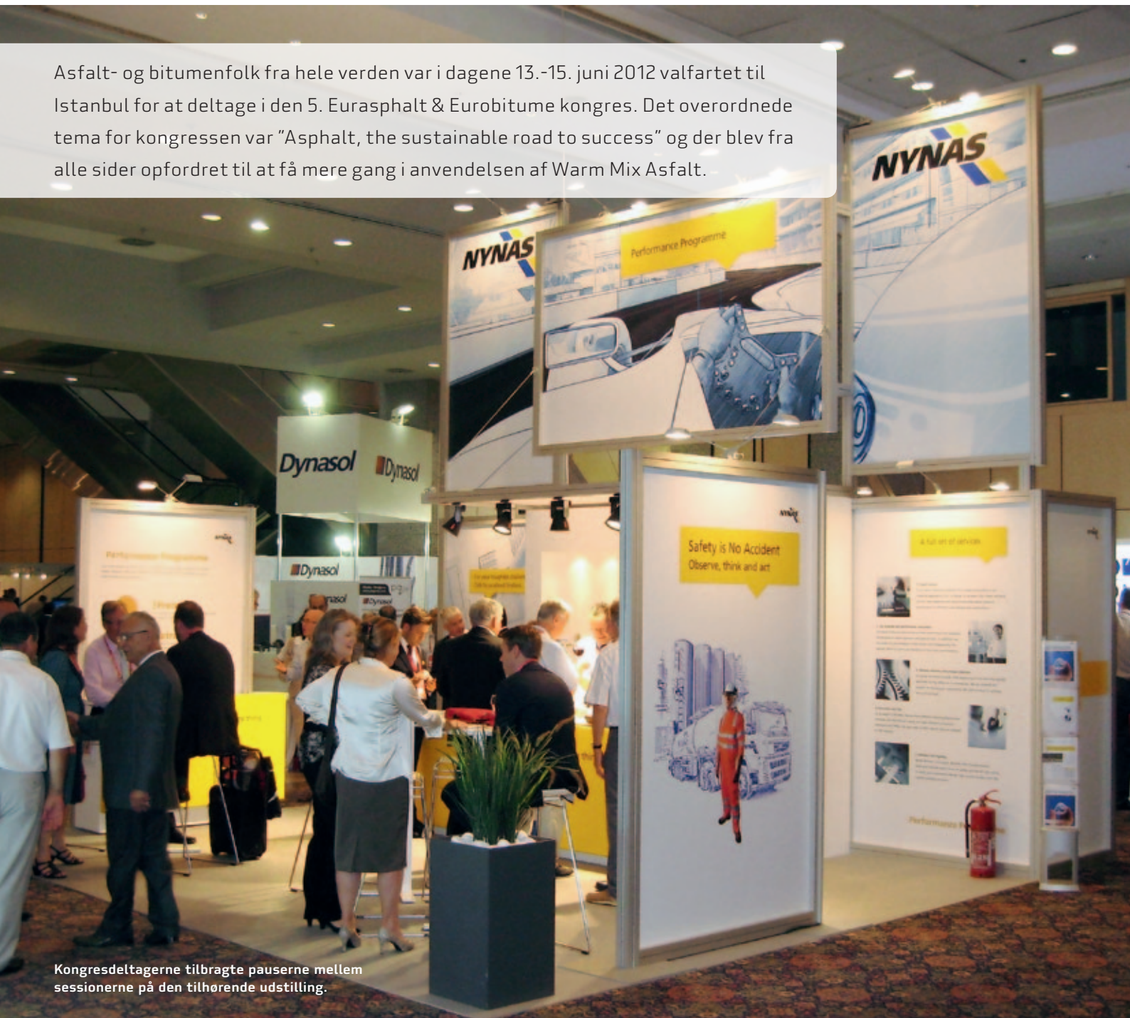
Kongresdeltagerne tilbragte pauserne mellem sessionerne på den tilhørende udstilling.

Asfalt- og bitumenfolk fra hele verden var i dagene 13.-15. juni 2012 valfartet til Istanbul for at deltage i den 5. Euraspalt & Eurobitume kongres. Det overordnede tema for kongressen var "Asphalt, the sustainable road to success" og der blev fra alle sider opfordret til at få mere gang i anvendelsen af Warm Mix Asfalt.