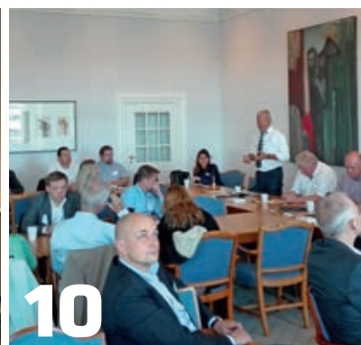
Dansk Vejforening arrangerede en succesfuld vejpolitisk debat på Christiansborg.