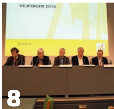
1.200 vejfolk deltog i Vejforum i starten af december.