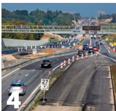
Det er vigtigt at bilisterne kører hensynsfuldt forbi vejarbejder, så vejarbejderne kan føle sig trygge ude på vejen.