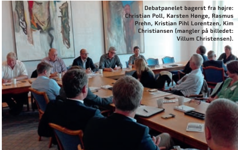
Debatpanelet bagerst fra højre: Christian Poll, Karsten Hønge, Rasmus Prehn, Kristian Pihl Lorentzen, Kim Christiansen (mangler på billedet: Villum Christensen).

skuffende resultat for vejbranchen. Men vi giver ikke op. Dansk Vejforening kan godt love, at det ikke er det sidste politiske møde, vi arrangerer, hvor vi kan gøre vores for at skabe en dialog, og vi ser frem til at sætte rammerne igen snart. ■