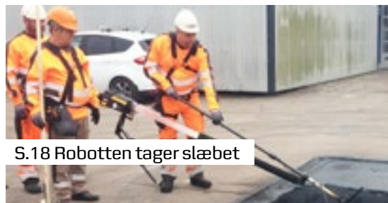
S.18 Robotten tager slæbet