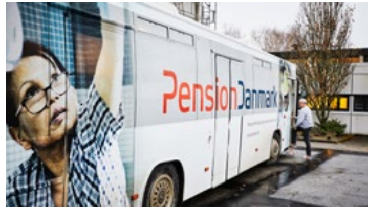
Rådgivningsbussen lagde vejen forbi erhvervsskolen Mercantec i Ulfborg i slutningen af november.

Sundhedsrådgiveren inviterer de besøgende op på en særlig vægt, hvor man bl.a. får målt sin fedt- og muskelmasse. Vægten angiver også ens body age , og herudfra får man en snak om sundhed, og sundhedsrådgiveren fortæller om mulighederne i PensionDanmarks sundhedsordning, der bl.a. giver adgang til behandlinger hos en kiropraktor, fysioterapeut, massør eller zoneterapeut.