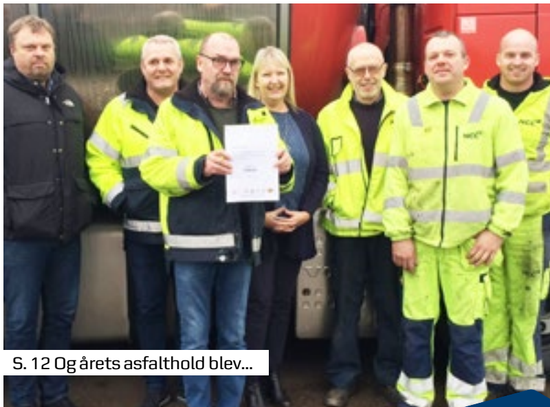
S. 12 Og årets asfalthold blev...