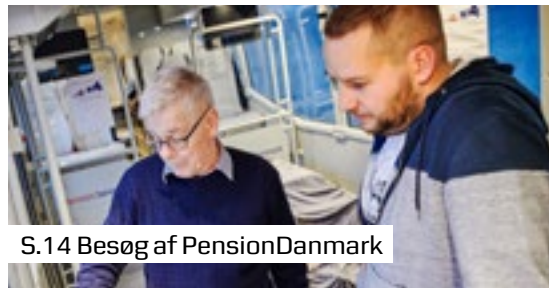
S.14 Besøg af PensionDanmark