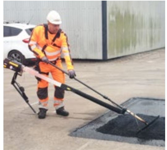
Exo-Push blev præsenteret hos Colas Danmark i Glostrup i starten af november.

Colas Danmark vil herefter evaluere, om Exo-Push fungerer i praksis ved både at forbedre arbejdsmiljøet og levere den samme høje kvalitet.